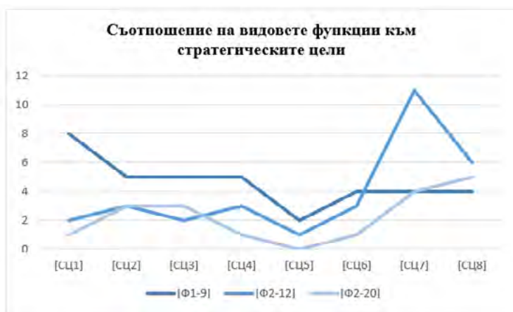
Фигура 1. Съотношение на видовете функции към стратегическите цели

Съотношението на видовете функции към стратегическите цели е изобразено на фигура 1.