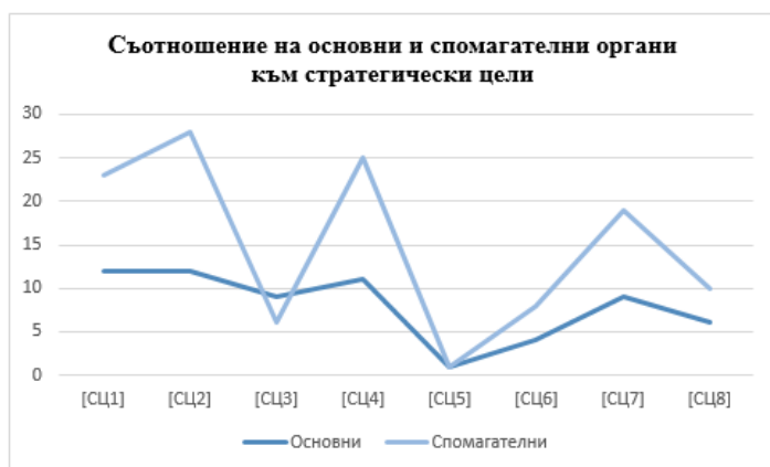
Фигура 2. Съотношението на основните и спомагателните органи към стратегическите цели

От фигура 2 се вижда, че въпреки амплитудата в броя на основните и спомагателните органи, тяхното нарастване, респективно – редуциране, е пропорционално. Това означава, че прилежащите им функции също варират по идентичен начин.