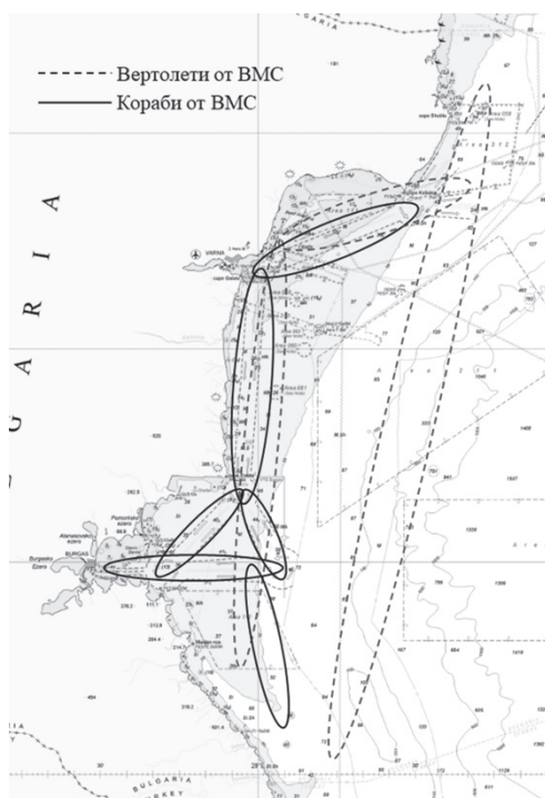
Фигура 2. Райони за проверка от Военноморските сили за наличие на мини.

вия от противоминните сили на Военноморските сили. Под формата на учения или целенасочено се извършват постоянни проверки за наличие на мини по транспортните коридори, които минават по нашето крайбрежие. В проверките участие вземат не само противоминни кораби, а и вертолети, които извършват основно визуална проверка за плаващи мини.