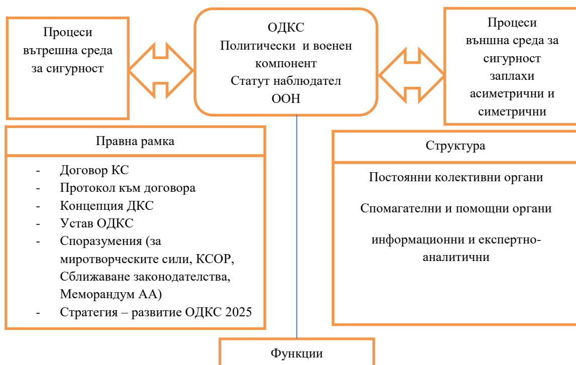
Фигура 2: Модел на ОДКС