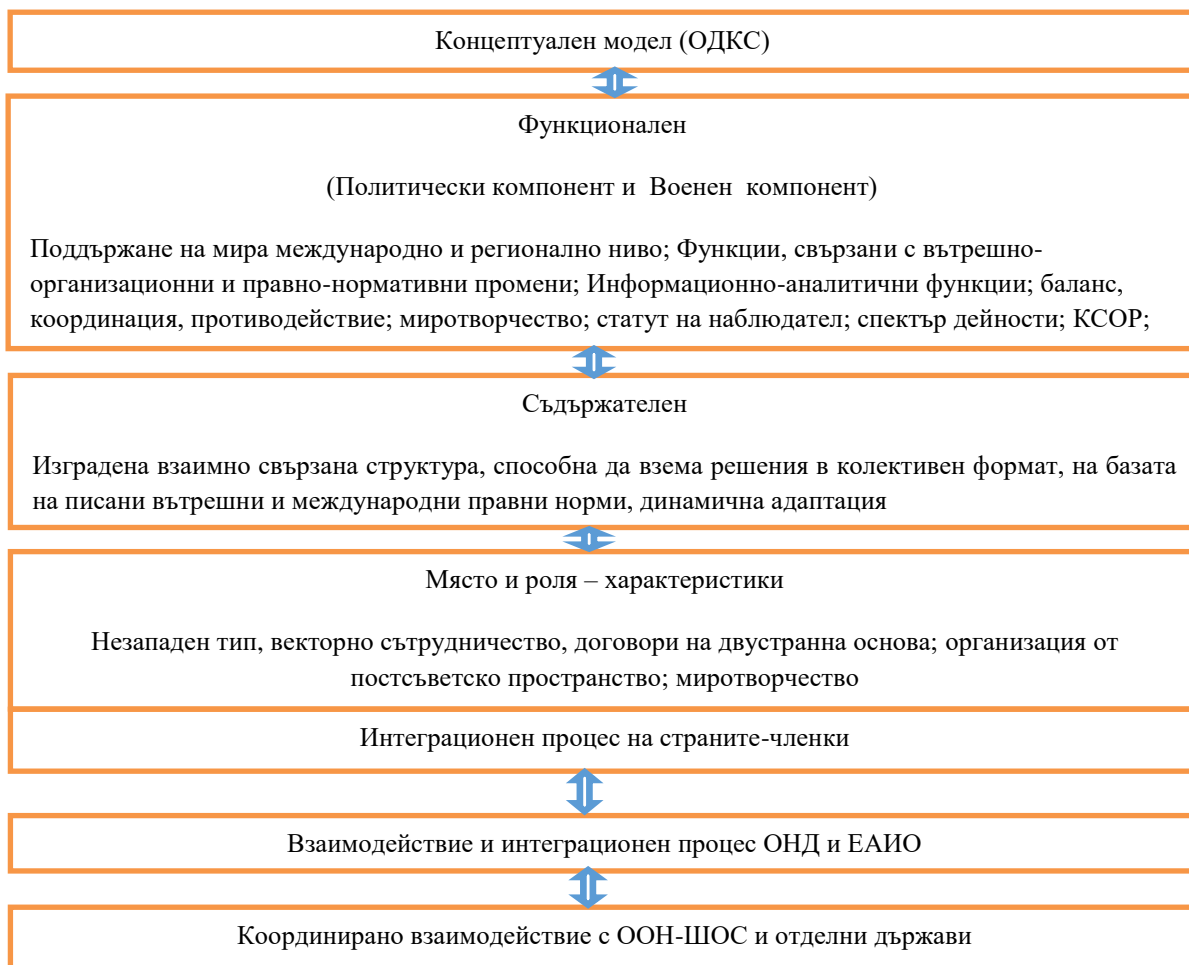
Фигура 4. Концептуален модел на ОДКС

Статутът ѝ на наблюдател в ООН е основание политическият компонент да сътрудничи с други държави или организации за поддържане на сигурността в проблемни региони.