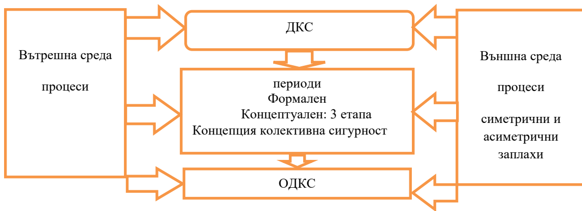
Фигура 1: Формиране на ОДКС