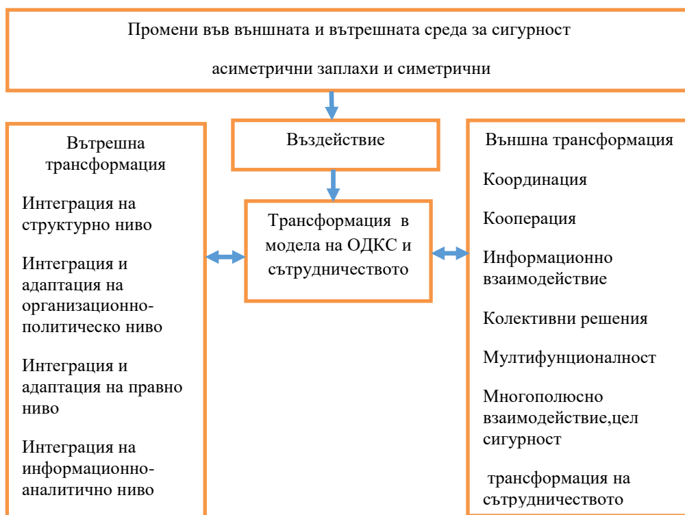
Фигура 6: Модел на трансформация в ОДКС

Колективните системи са свързани с политиката, правата на суверенитет и равно участие. Трансформацията в модела на сигурност извежда синергизъм вътре в модела на ОДКС. Ефективно действащ принцип е координирано взаимодействие , допълнен от принципите на консенсус , на конструктивно въздържане и решение в строг подреден формат . Трансформацията на сътрудничеството на ОДКС е развита от политическия компонент. Моделът трансформация на сътрудничество е външна динамична проекция в международните отношения на концептуалния модел. Извежда собствено ресурсно и финансово осигуряване. Ресурсът нараства до необходим за противодействие при критична промяна в равновесието на заплахите и предизвикателствата. Основните характеристики на трансформацията на модела е времевата му проекция и гарантирането на достатъчна колективна сигурност. Той дава отговор на параметрите за комбинирана система и залага на съвместимост с организации и държави на основата на съвпадащи приоритети, интереси и ценностни предпочитания. Трансформацията на модела и отворения тип